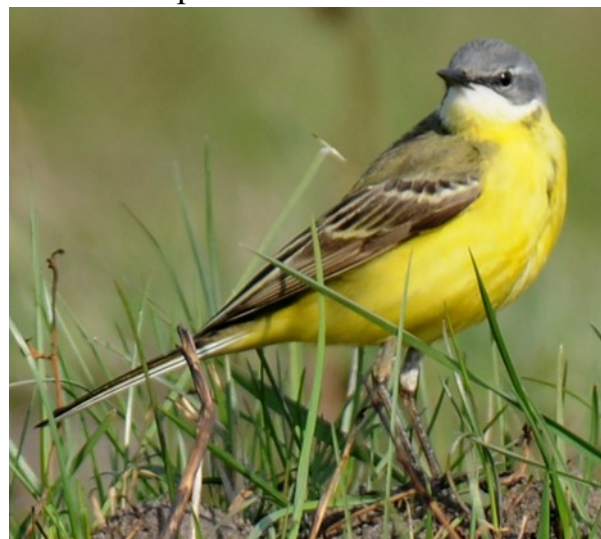
Informāciju sagatavoja Ilona Gricāne

Latvijā sastopamas ir četras cielavu sugas - baltā cielava (Latvijas nacionālais putns), dzeltenā cielava, kā arī citroncielava (ligzdo pļāvās) un pelēkā cielava (Latvijā reta ligzdotāja pie straujām upītēm). Dzeltenā cielava pārtiek gandrīz tikai no kukaiņiem, visbiežāk ēd dažāda veida mušīņas. Jo daudzveidīgāka dzīvotne ir kukaiņiem, jo vairāk barības putniem un zvēriem.