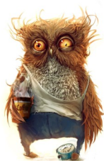
Nauczyciel pod koniec roku szkolnego